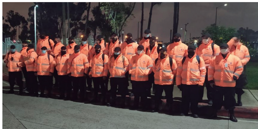
Personal logístico ubicado desde las 10 pm hasta las 8 am