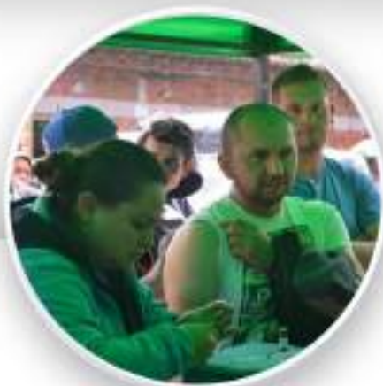
Jornada de vacunación contra sarampión, rubeola e Influenza realizada en la Central Mayorista.