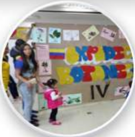
Integración de los diferentes ciclos escolares. Los estudiantes se empoderan de la reflexión acerca de sentido de pertinencia con Corabastos.