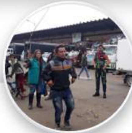
Por medio de los juegos tradicionales se pudo observar el reconocimiento de las problemáticas sociales que afectan a los comerciantes con el fin de mitigarlas y mejorar su calidad de vida.