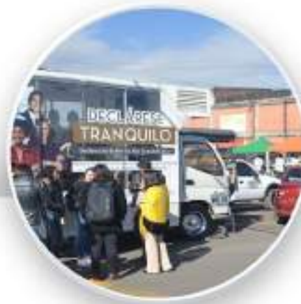
Presencia de la DIAN en la Corporación para tramites de Rut y Declaración de Renta.