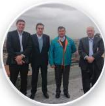
Visita del Departamento de Agricultura de los Estados Unidos.

Dada la importancia que tiene Corabastos para las entidades públicas, privadas, etc, periódicamente la administración recibe comunicaciones para realizar eventos de índole social, económica, de servicio, cultura, deportivo, promocional entre otros. Agosto y septiembre fuimos escenarios de importantes visitas: