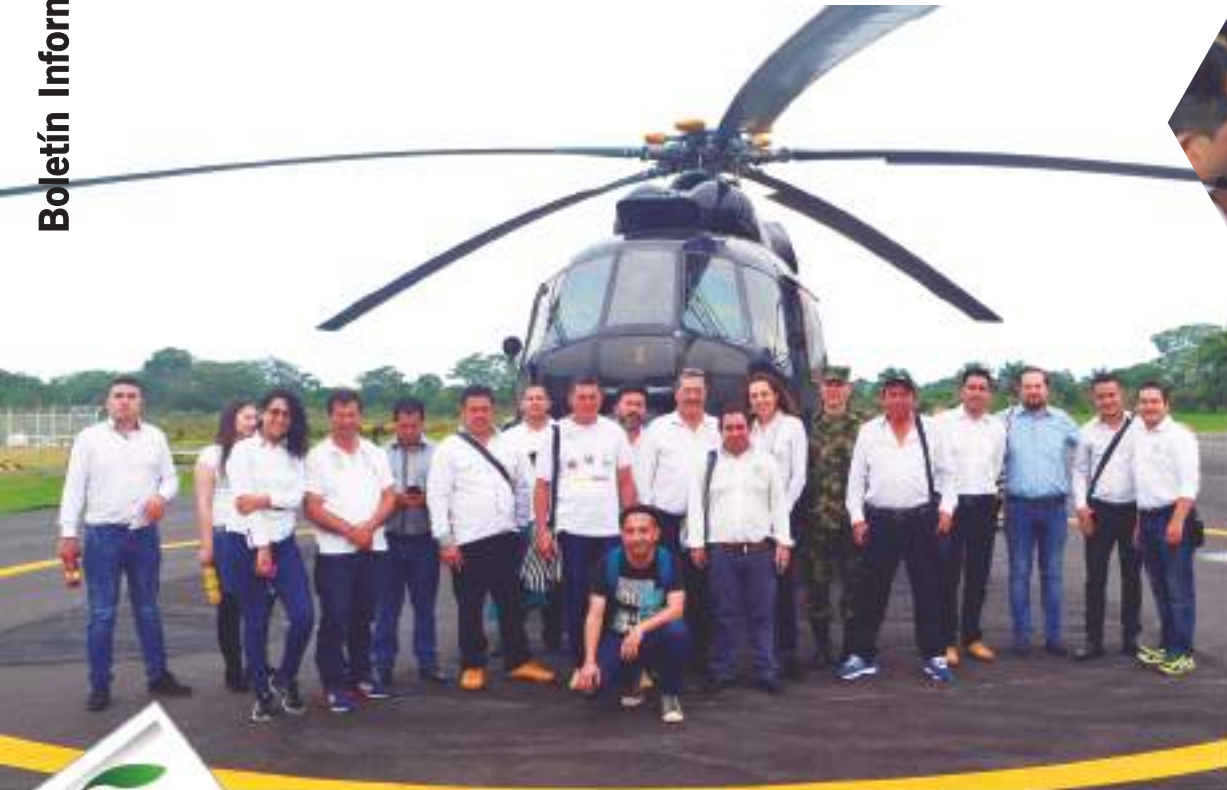
Rueda de negocios: Mesetas, Meta 24 de Marzo 2018